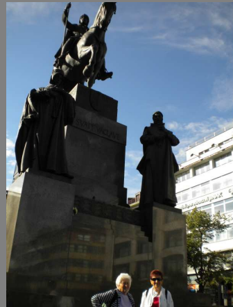
Socha svatého Václava