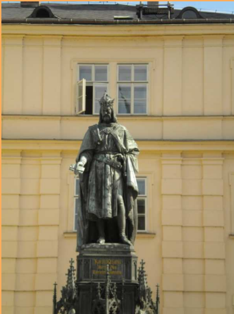
Karlův most - socha Karla IV.