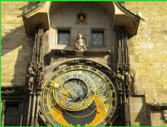
Staroměstská radnice s orlojem